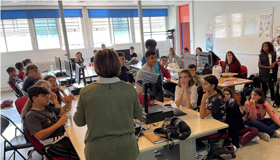
[Jour 1 : ateliers au Pixel]