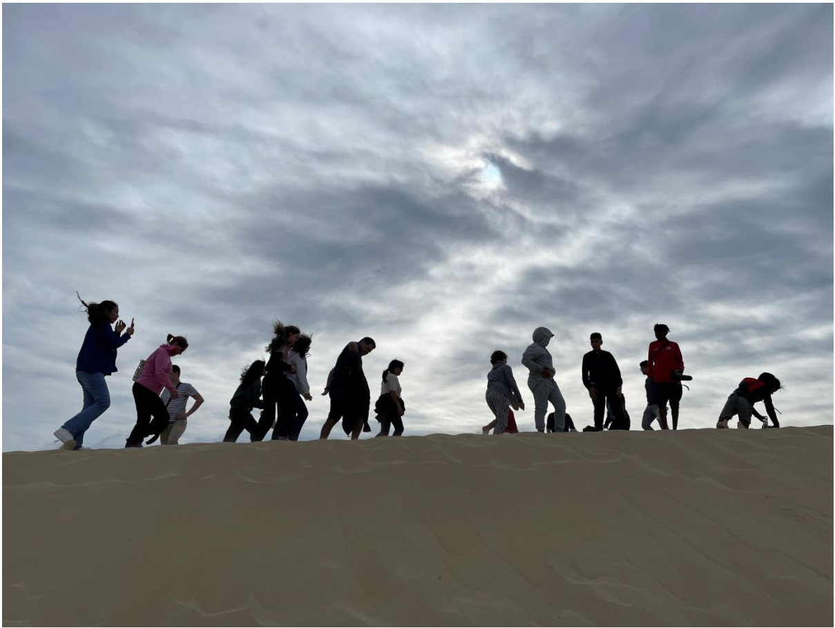
[Sortie Dune du Pilat, J3]