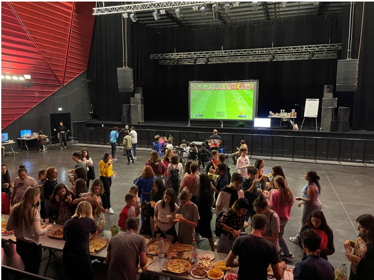
[soirée e-sport au Rocher de palmer, J1]