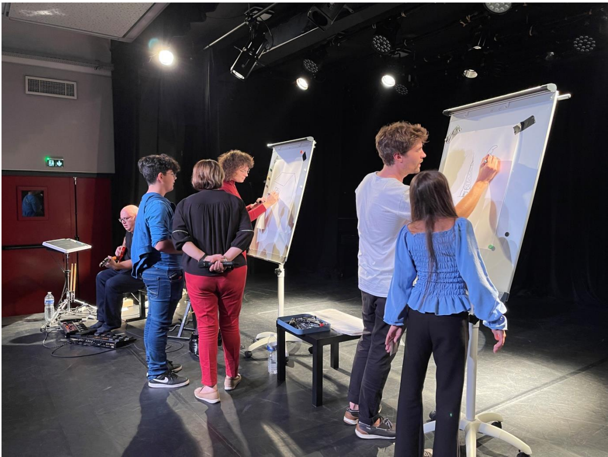
[battle de dessins avec la Cie Il était une fois, J3]