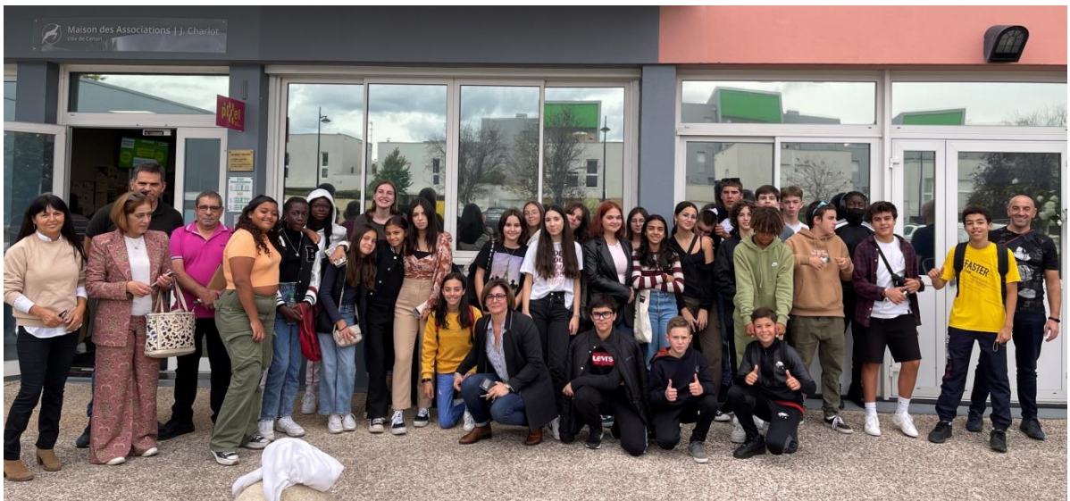
[Ateliers au Pixel, J2]