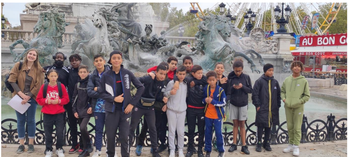
[Visite de Bordeaux avec l'Office du Tourisme, J2]