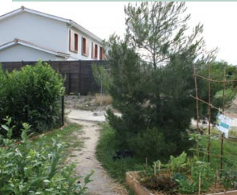
Plantation en bacs près de la résidence les Jardins d'Estrées

Le jardin partagé s'inscrit dans la démarche d'Agenda 21 et protège la nature en véhiculant des principes liés au développement durable et à l'éco-citoyenneté. Récupération de l'eau de pluie pour l'arrosage, construction de toilettes sèches et respect de la biodiversité animale et végétale. Les habitants sont sensibilisés aux questions écologiques. Aménagés à côté d'un ancien site de l'INRA (Institut National en Recherche Agronomique) qui travaillait avec des produits chimi-