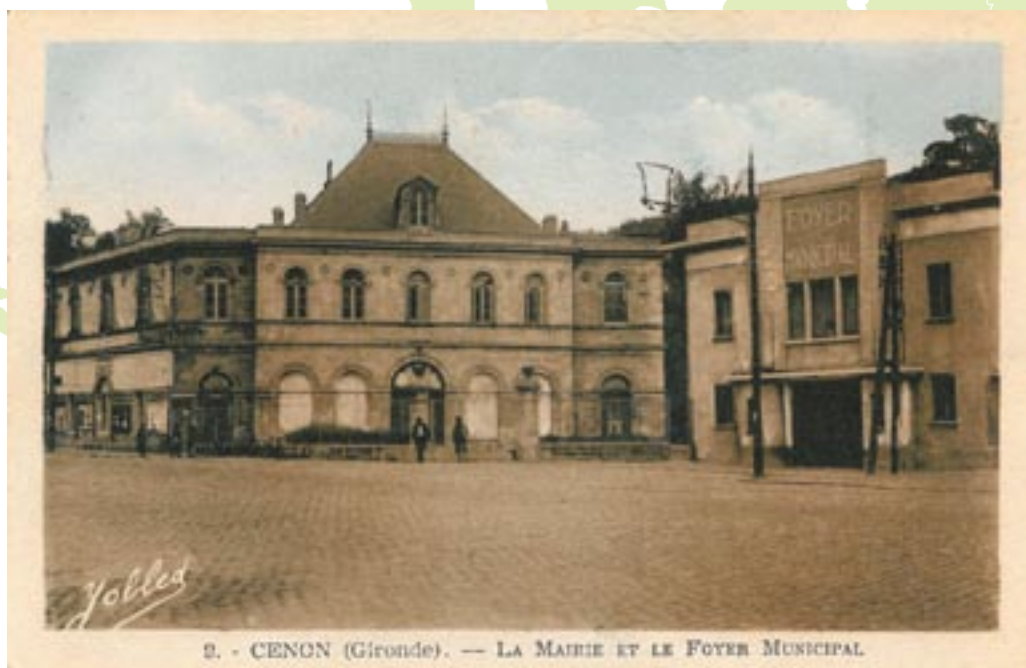
carte postale le : 1 Fi 4/21

Sur cette carte postale, à droite de la mairie, on aperçoit le foyer municipal. Acquis en 1913 avec l'ensemble du parc ce bâtiment était à l'origine un immense chai. C'est en 1932 que la municipalité émet le souhait de créer une salle des fêtes avec salles de réunion et bains douches, regroupés sous le nom de foyer familial municipal. On choisit alors d'aménager cette bâtisse. Le foyer ouvre ses portes quelques années plus tard, le 20 février 1936, et avec lui un cinéma, le Ciné-Star, régi par Monsieur Goupy et des bains douches. Il fallait compter 3,50F pour prendre un bon bain savon compris. Le foyer animera la vie des Cenonnais durant près de 40 ans, avant la fermeture du cinéma en 1973. Transformé en salle Simone Signoret dans les années 1980, le bâtiment devient à la fois un lieu de représentations où les spectacles de chant, danse, théâtre et conférences se succèdent, témoin de la diversité culturelle de la ville de Cenon.