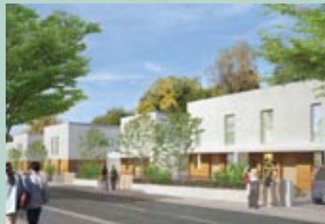
Maisons Axanis, rue André Gide

>> 38 logements La Foncière en loyers libres dans un bâtiment conçu par les ateliers d'architectures