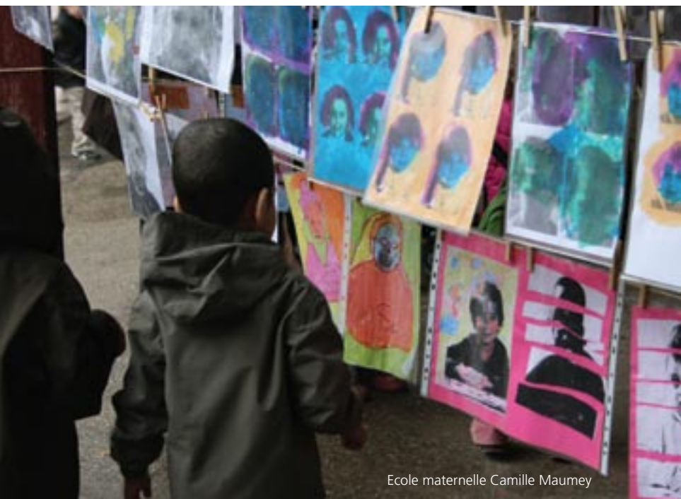
Ecole maternelle Camille Maumey