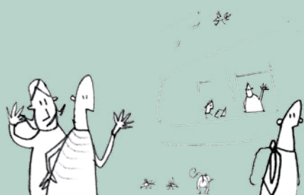
Logements étudiants rue André Gide

SARAILLÈRE, RONCEVAL, MARÈGUE, ETC. LA RÉNOVATION PROFONDE DE CETTE PARTIE DE CENON GARANTIT AUX HABITANTS UN BON ÉQUILIBRE ENTRE BÂTIMENTS AUX PROPORTIONS MAÎTRISÉES ET NATURE PAYSAGÉE, DANS LE RESPECT DE LA CHARTE DE QUALITÉ URBAINE DU GRAND PROJET DES VILLES.