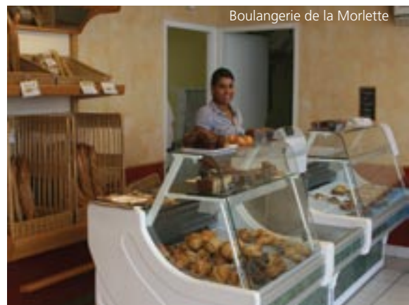
Boulangerie de la Morlette