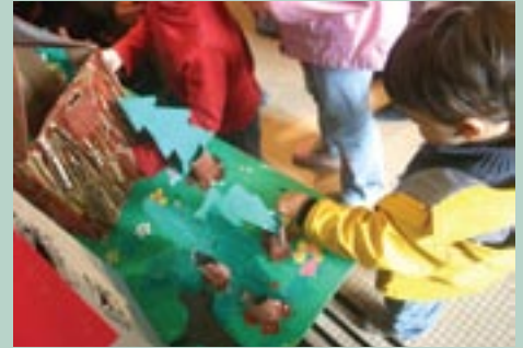
Milo à petits pas...

Les micro-crèches fonctionnent à l'identique d'une crèche classique à l'exception de leur taille. Ici le lieu est une maison spacieuse et confortable qui consacre une partie de son es-