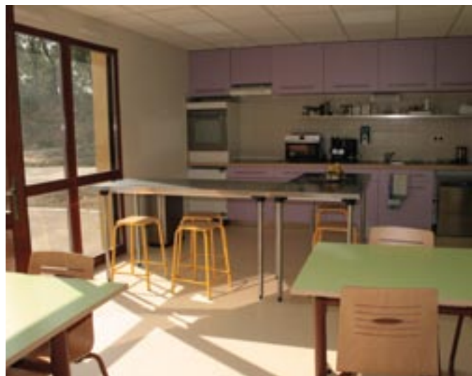
La lumière et la nature participent au bien-être des résidents