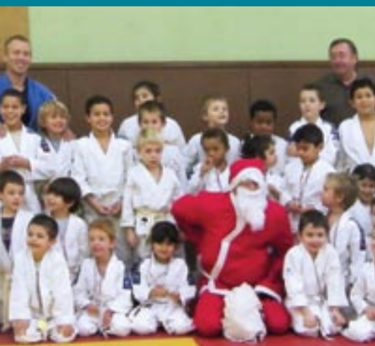
Un père Noël attentif au bonheur des petits judokas !

Dès début septembre les judokas du club de Cenon ont repris avec vigueur leur entraînement sur les tatamis du dojo du gymnase Palmer. Une reprise placée sous le signe de la reconquête d'un état d'esprit de club familial alliant à la fois le judo de haut niveau, le judo loisir, le judo éducatif et le soucis permanent d'apporter du bonheur aux enfants. Mais une rentrée également teintée d'une pointe de nostalgie, pour les plus anciens, leurs entraîneurs et les responsables du club. Ces derniers devraient quitter ce dojo construit en 1989, qui avait abrité jusqu'ici les efforts, les chutes et les exploits de centaines de jeunes combattants pendant 2 décennies.