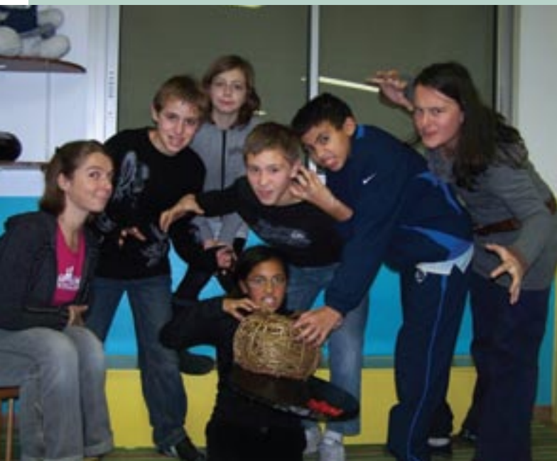
L'équipe du court-métrage «Tout mon cœur»

Connaître les adultes à qui on confie ses enfants favorise confiance et bien-être. Pour se connaître, il est nécessaire de se parler, de faire des choses ensemble. Plusieurs lieux d'accueil pro-