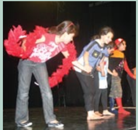
Le Cenon Comedy Club sur scène

Tous les partenaires du projet éducatif local savent aussi que la santé des enfants reste le préalable indispensable à un bon parcours scolaire.