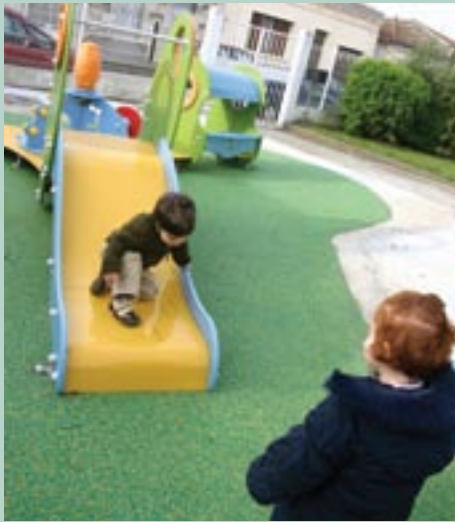
Micro crèche et maxi jeux

Le bas Cenon accueille depuis le 1er septembre 2008 deux micro-crèches à destination des