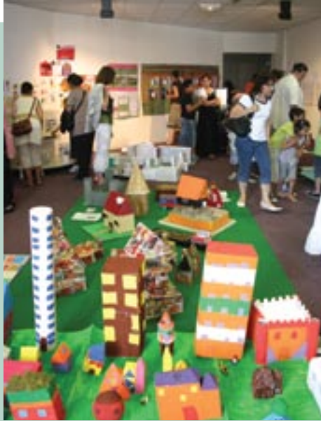
Oeuvres des enfants créées à l'occasion du Prix Littéraire Jeunesse 2009

Ecole et loisirs sont indispensables et complémentaires dans l'épanouissement des enfants. Plusieurs dispositifs existent depuis longtemps à Cenon pour aider à la réussite scolaire et humaine. Des passerelles entre les multi-accueils et les