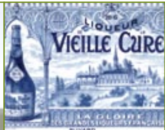
> Journées du Patrimoine expo. «La Vieille Cure»