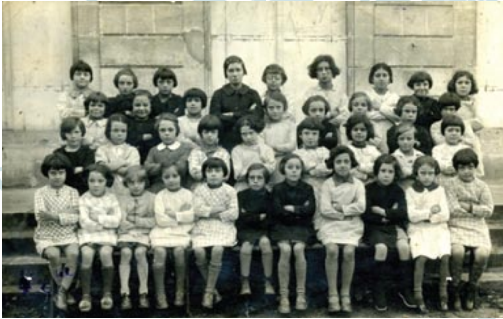
Ces petites filles bras croisés et coupes au carré ont été photographiées à l'école des Cavaillès. Malheureusement, nous ne savons pas en quelle année, peut-être saurez-vous nous renseigner ? Un indice : à l'époque le sérieux était de mise...