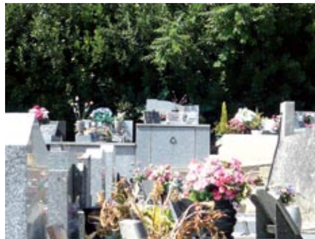
L'entretien des sépultures est un devoir légal