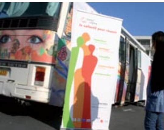
A la rencontre des porteurs de projets place François Mitterrand