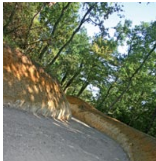
Le béton concassé, issu des démolitions d'immeubles, consolide le chemin 53.

1,3km du chemin 53, le promeneur sera saisi par la diversité paysagère, alternance d'espaces sauvages et travaillés : bosquet de chênes verts, grandes prairies, bois laissé à l'état brut, sources et fontaines, belvédères et terrasse panoramique, zone de mouillère, falaises calcaires... Une flore et une faune aux portes de la ville d'une richesse insoupçonnée qui répond aux caractéristiques du site : forme en fer à cheval, ensoleillement et sols variés. Le chemin 53 et une grande partie du parc sont accessibles aux personnes à mobilité réduite avec des pentes inférieures à 4%. Les sportifs pourront aussi emprunter les chemins de terre annexes. Pour parfaire l'esthétisme et inviter aux haltes, sont posés ici et là des gabions et des bancs taillés à même les troncs d'arbres (ceux abattus suite à la tempête Klaus et dont la majeure partie a servi à la restauration d'une goélette).