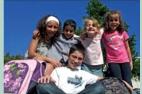
Pause photo à l'école Léon Blum

La santé des élèves fait partie des fondamentaux. Des Projets d'Accueils Individualisés sont menés en collaboration avec des médecins scolaires, des parents et des enseignants, pour améliorer l'accueil scolaire des enfants ayant des soucis médicaux. Des rencontres régulières permettent de fournir des solutions concrètes aux problèmes d'allergies alimentaires, d'asthmes, voire de maladies plus graves qui nécessitent une prise en charge particulière de l'école. Chaque agent municipal suivra également une formation aux premiers secours.