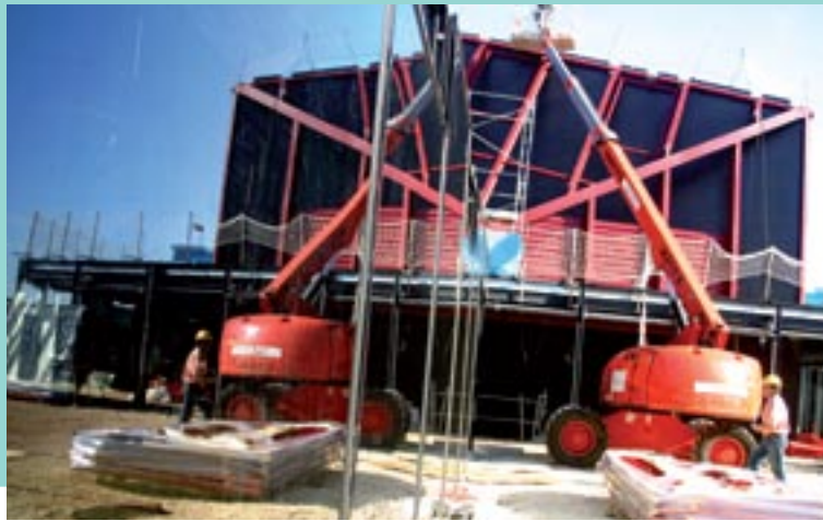
Pose des coques rouges plissées sur le toit du Rocher

Autre élément remarquable, la galerie de verre teinté. Entourant le Rocher de Palmer d'une promenade vitrée, cet espace de déambulation réserve d'agréables surprises. Encore en construction sur le côté sud, face au parc Palmer, les parties courives et façade de la salle 650 places nous dévoilent d'ores et déjà un premier appareil. Translucide lorsqu'on s'approche des vitres ou qu'on traverse la galerie, elle s'opacifie et se fait jeu de miroir en fonction des angles d'observation. Cet effet pensé par les architectes est la résultante d'un travail de sérigraphie sur tous les éléments verriers. Une manière esthétique de dissimuler les pièces techniques situées en partie haute et basse de la galerie, tels que les câbles de courants, électriques, de téléphones, d'incendie ou de sonorisation.