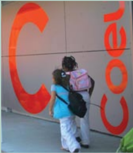
L'école René Cassagne en cours de rénovation

Autre chantier d'envergure, l'extension du groupe scolaire Jules Guesde. L'ouverture de la CLIS maternelle sera suivie de celle de