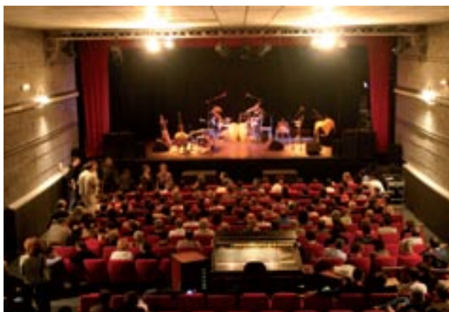
Haddouck Trio, salle S. Signoret en 2005