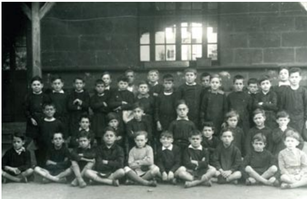
En 1932, les garçons de l'école Camille Maumey semblaient bien déterminés. Têtes hautes et regards rieurs étaient de la partie pour égayer une tenue de circonstance : le fameux uniforme noir! Mais alors, qui étaient ces deux jeunes gens vêtus de blanc que l'on aperçoit au premier rang ?

Les cartes postales anciennes que nous publions sur cette page appartiennent à un fonds acquis par la Mairie auprès d'un collectionneur cenonnais en 2008, fonds qui sera progressivement valorisé et rendu accessible. Ces images de notre ville portent souvent (mais pas toujours) un titre qui permet de localiser le quartier qu'elles montrent. Elles sont très rarement datées. Les bâtiments photographiés ont souvent disparus ou ont été modifiés. Parfois y figurent des personnes. Pour compléter notre connaissance du passé de Cenon, nous faisons appel aux savoirs de tous ceux qui s'intéressent à l'histoire locale. Pour partager vos informations éventuelles sur ces images, rendez-vous dans l'espace FORUM du site Internet www.ville-cenon.fr