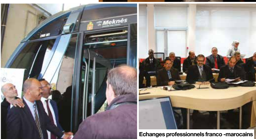
Echanges professionnels franco-marocains