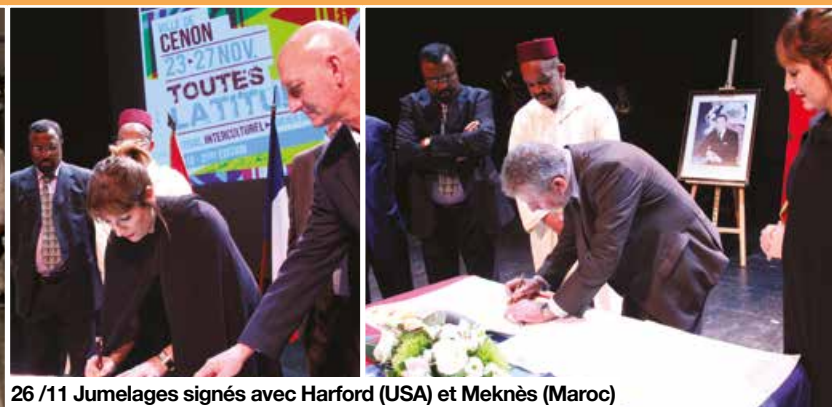
26 /11 Jumelages signés avec Harford (USA) et Meknès (Maroc)