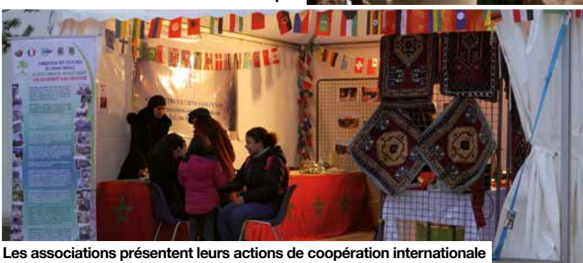
Les associations présentent leurs actions de coopération internationale