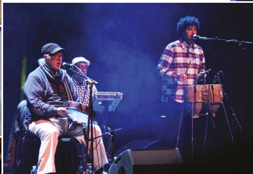
Nass El Ghiwane, concert vibrant du mythique groupe marocain !