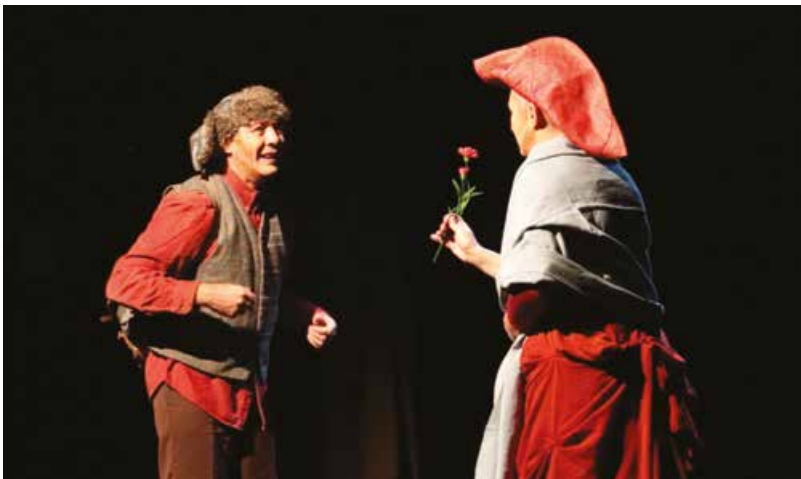
«Une poule sur un mur... qui attend» : un spectacle sur les animaux pendant la Grande Guerre par le Théâtre du Petit Rien