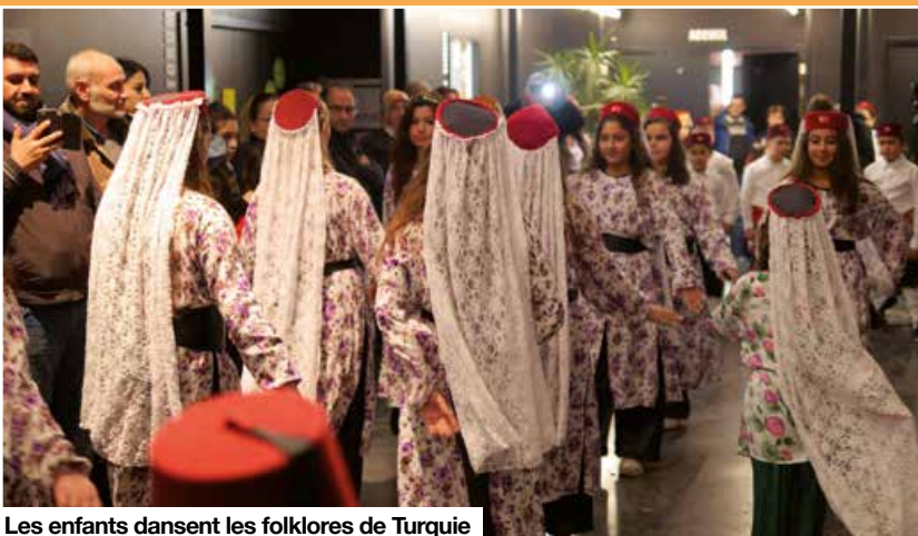
Les enfants dansent les folklores de Turquie