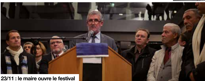
23/11 : le maire ouvre le festival