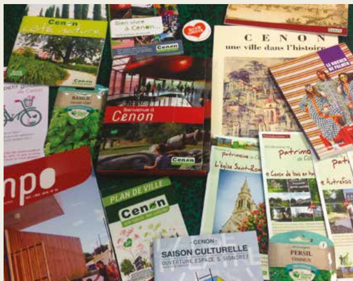
Le kit d'informations remis aux nouveaux Cenonnais

de stage. Durant ces quelques mois j'ai découvert chaque recoin de la ville, même les plus cachés. Mais ce qui me ravit le plus, c'est l'Espace Simone Signoret, car j'aime beaucoup le théâtre, et le parc Palmer que je vois depuis ma fenêtre. Loin de mon île, je retrouve beaucoup de verdure autour de moi, et du calme également. Je me sens chanceuse d'être dans une ville intermédiaire : entre ma petite vie tranquille d'insulaire et la Métropole qui, niveau rythme, ne s'arrête jamais.