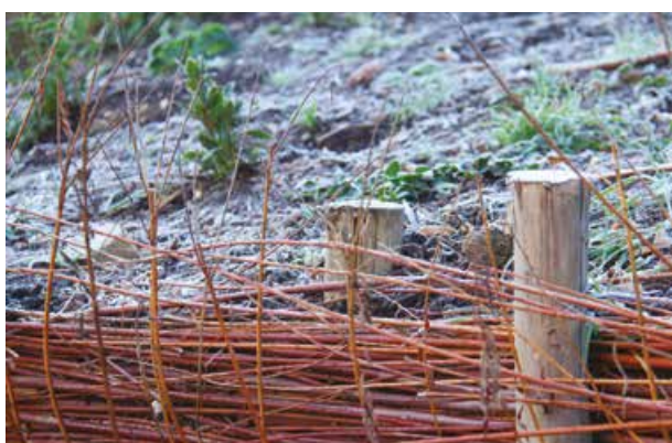
Les fascines : branches de saule vivantes tressées, amenées à s'enraciner...

Les fascines, installées en espaliers, rehaussent la trame verte qui court rue du Maréchal Foch, le long de Beausite. Maintenues par des piquets et de la toile de coco, elles sont constituées de branches de saule vivantes tressées, amenées à s'enraciner et à compléter la végétation de sous bois existante. Une technique dite de génie végétal, qui sait utiliser la nature et ses propriétés pour consolider les terrains pentus, difficiles d'accès et d'entretien. Parallèlement, les trottoirs ont été élargis en retirant la terre tombée avec le temps, et une barrière constituée de madriers et de pieux en chêne retient durablement le talus du coteau. Ces travaux pris en charge par la ville achèvent avec intelligence, sécurité et cohérence l'ouverture du quartier sur la ville.