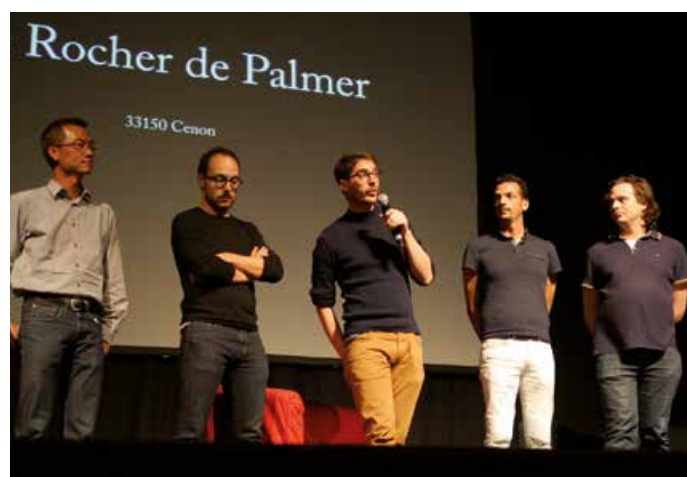
Jeunes entrepreneurs du secteur des arts et de la culture au Rocher de Palmer

Ensemble, ils ont conçu, testé, développé, mis en ligne une boîte à outils prototype (elle sera définitive courant 2017) proposant des ressources utiles. Ce «couteau suisse» YEA, en 4 langues, servira à tout jeune entrepreneur perdu dans la complexité des dispositifs, des administrations du secteur culture et ICC. Les téléchargements ont été nombreux à ces rencontres.