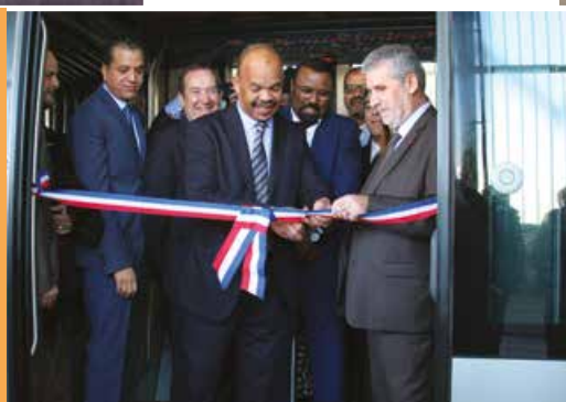
Baptême de la rame de tramway «Meknès»

Sur mon BLOG http://caneil.ville-cenon.fr