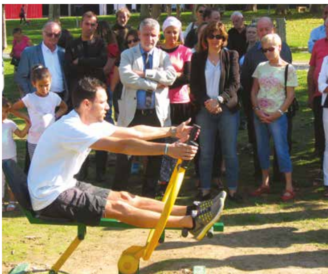
24 septembre : Inauguration des modules de fitness au parc Palmer

Au pied du château Palmer, neuf appareils de fitness proposent de travailler le cardio et le renforcement musculaire.