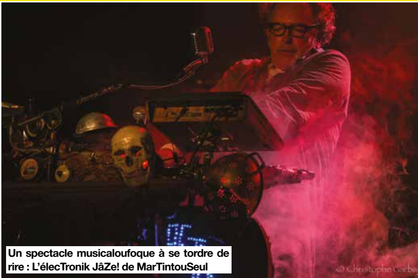
Un spectacle musicaloufoque à se tordre de rire : L'élecTronik JâZe! de MarTintouSeul