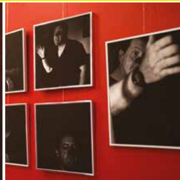
Des expos : Fruits des résidences artistiques de l'action «La Fronde» avec les habitants d'Henri Sellier