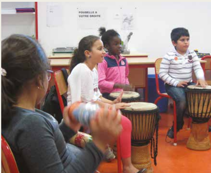
Ecole René Cassagne : des percussions qui se frappent, se grattent, se secouent...

L'organisation TAP et celle des APS change et s'assouplit pour répondre aux attentes des parents et aux besoins des enfants. Les T.A.P. sont