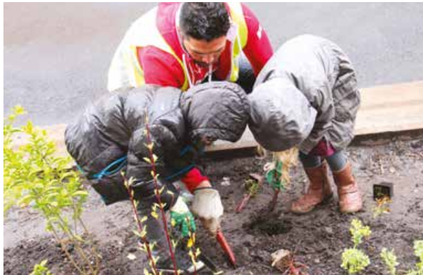
La plantation, un temps de concentration...