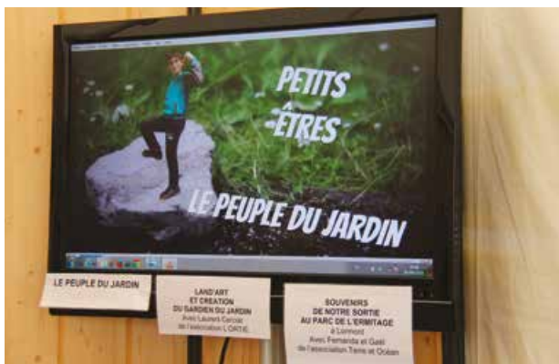
Le jardin pour tous présenté lors des Juniors du développement durable 2016

soin de l'environnement, développer la capacité créative de chacun, intégrer la notion de cycle de vie... la nature s'est révélée un sujet d'étude ludique, multidisciplinaire et porteur de nombreuses vertus. Les élèves ont patienté jusqu'à la fête de l'école en juin dernier, pour montrer et d'expliquer le fruit de leur travail collectif à leurs parents.