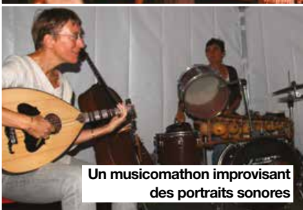
Un musicomathon improvisant des portraits sonores