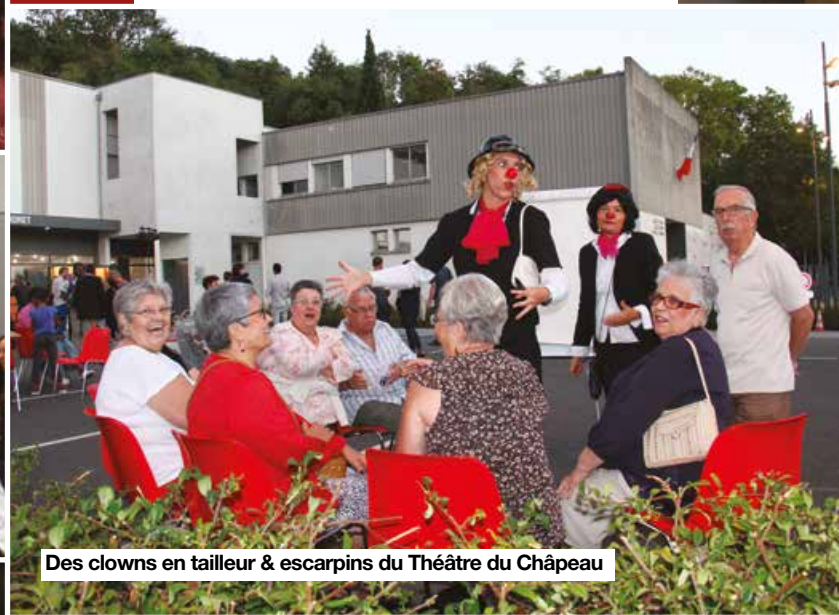
Des clowns en tailleur & escarpins du Théâtre du Châpeau