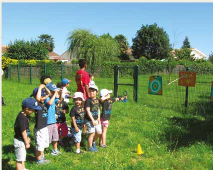
Décath'Kids : les tout petits s'initient au tir à l'arc