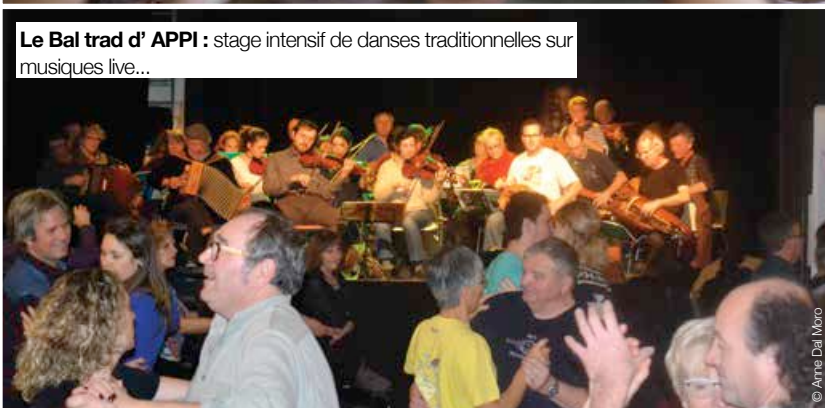
Le Bal trad d' APPI : stage intensif de danses traditionnelles sur musiques live...