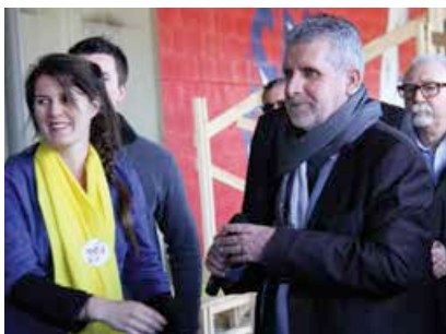
Alain David, Maire de Cenon, samedi 19 mars, à l'ouverture du «Tube», parc d'attraction éphémère...

La lutte contre le chômage est une véritable bataille de tous les jours et c'est un objectif prioritaire pour moi et pour mon équipe. C'est pourquoi, le service Emploi est positionné au sein de mon cabinet.