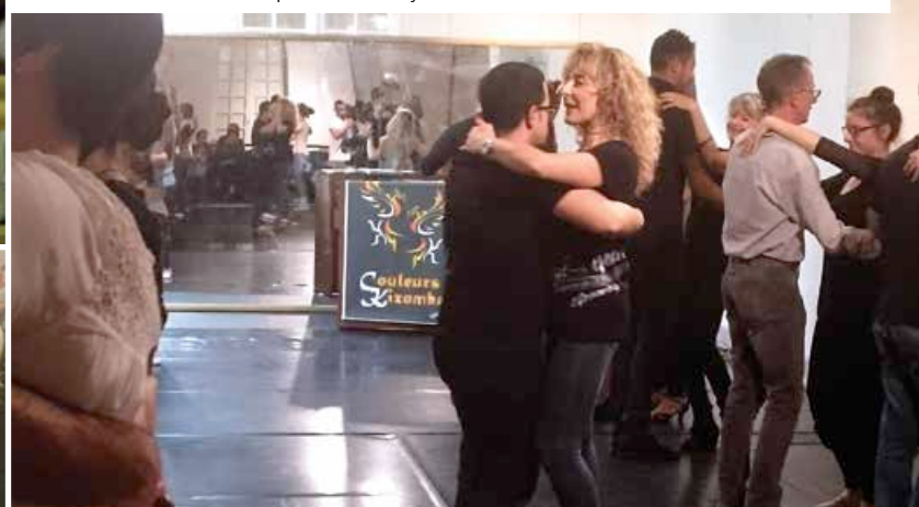
Couleurs Kizomba : «La grâce du tango, la chaleur du zouk...»