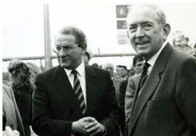
Pierre Garmendia au côté de Michel Delebarre, Ministre des Transports, lors de l'inauguration de la rocade rive droite