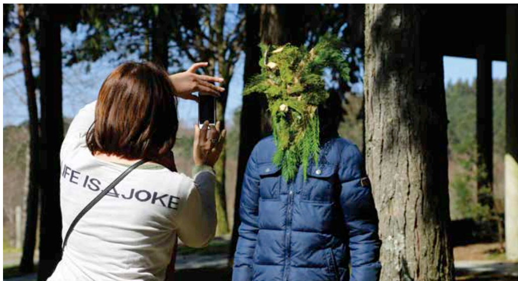
Essayage des masques

http://cowboysandgirlserasmus.blogspot.fr/ Sur Youtube : Cow-boys and girls / Cenon-Paredes de Coura