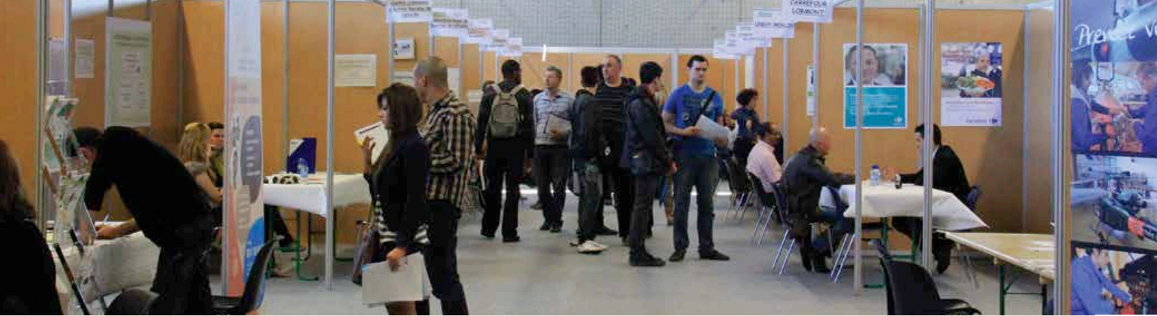
Au forum «Parlons emploi»