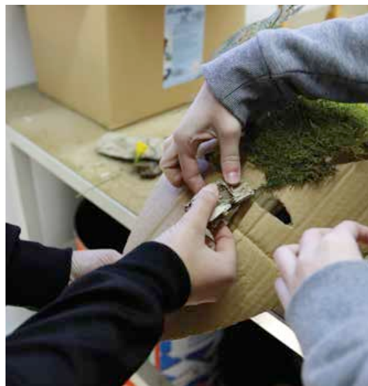
Création des masques