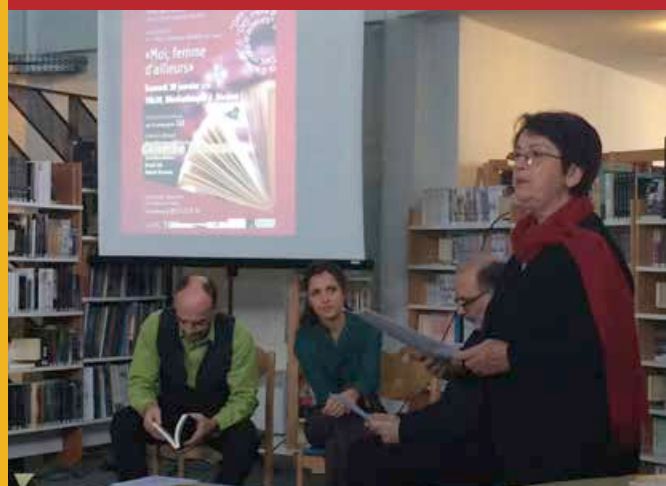
Lancement du Prix littéraire à la médiathèque J. Rivière

«...Ville de paix et de diversité Le Rocher de Palmer est immense repère Lieu de plaisir et de fraternité...»