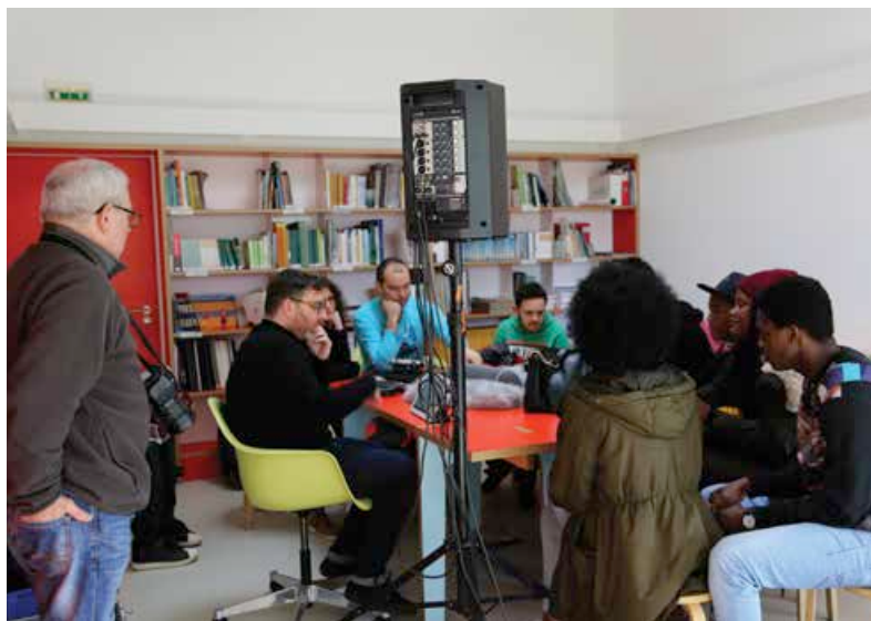
Atelier Prise de son au lycée Eprami

+ D'IMAGES sur la version tablette «Cenon Tempo»