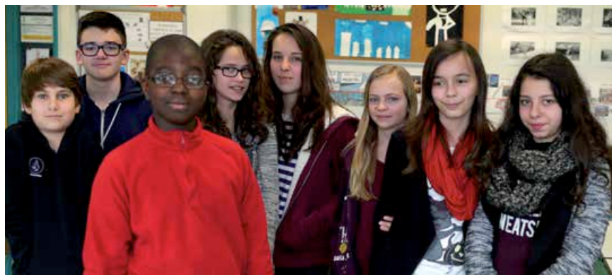
Les élèves des classes CHAAP du collège J. Zay

A voir & A écouter sur la version tablette «Cenon Tempo»