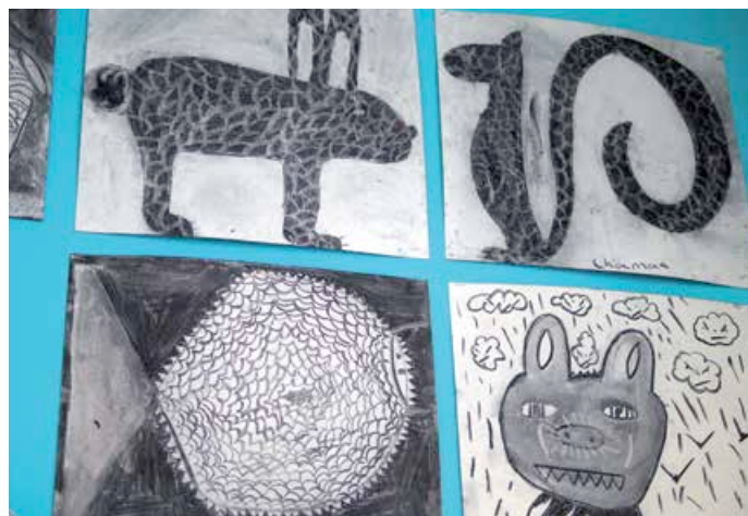
Créatures mythologiques, monstres, dragons... Les créations des élèves de la classe CHAAP, exposées à côté de celles des artistes

Pauline Viorrain est chargée des relations avec les scolaires pour Musiques de Nuit : «Nous allons accueillir les œuvres des classes et une projection du film de Philippe Coudray : «Au cœur de la forêt du