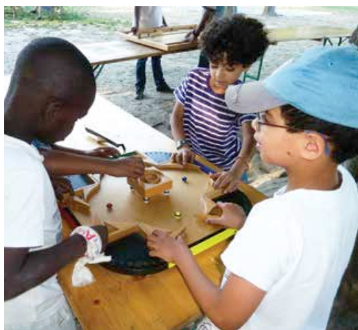
Centre de loisirs Triboulet

Le Projet Educatif de Territoire est aussi un outil de collaboration locale qui rassemble la Ville et les acteurs intervenant dans le domaine de l'éducation : Ministère de l'Éducation Nationale, Ministère des Sports, de la Jeunesse, de l'Éducation populaire et de la vie associative, Caisse d'Allocations Familiales, associations de jeunesse et d'éducation populaire, associations sportives, culturelles, artistiques ou scientifiques, représentants de parents d'élèves, etc.