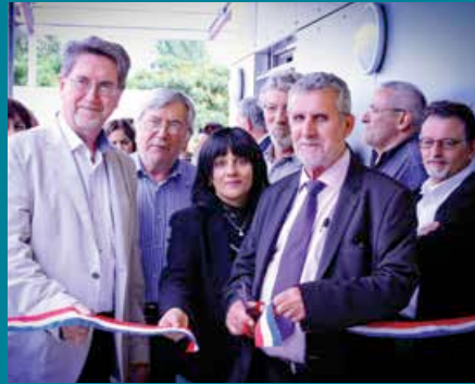
Inauguration du multi accueil «La Colline» le 23 septembre 2014

A Cenon, l'éducation pour tous pour la réussite de tous