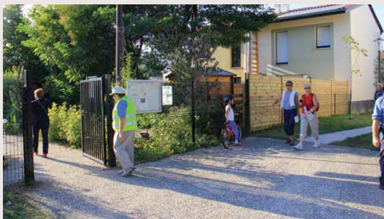
Randonnée dans le quartier renouvelé du 8 mai 45

La mise en place de conseils citoyens est la condition préalable à la signature du contrat de ville, ce document qui va structurer la stratégie territoriale de la politique de la ville. La loi installe institutionnellement le conseil citoyen ou son représentant auprès des élus, pour l'élaboration, la mise en œuvre et l'évaluation des contrats de ville. Pour reprendre la formule de la coordination nationale citoyenne, « cela ne se fera plus sans nous », nous les habitants, nous les citoyens.