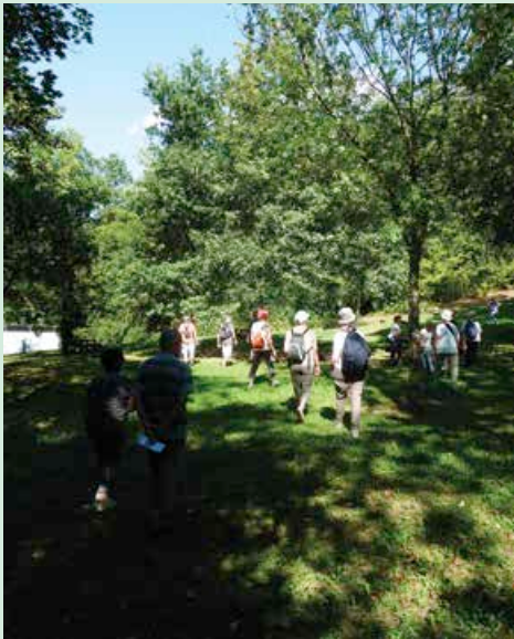
Promenade «Au pied de la colline» le 21 septembre 2014

Au fil de ses rues, passages, parcs, bâtiments et habitants, Cenon se raconte. Le temps d'une promenade, la ville se révèle et dévoile ses quartiers et trésors cachés.