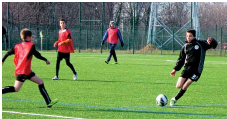
Section Football du collège Jean Jaurès