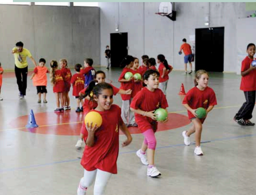
Handball au complexe sportif multi-activités La Morlette