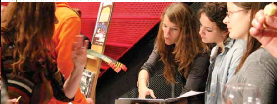
Réception d'accueil des nouveaux Cenonnais le 25 octobre 2013 au Rocher de Palmer

Retour en images, vidéo et textes sur le www.ville-cenon.fr