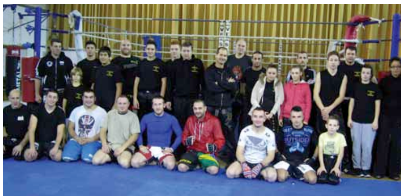
Une partie du Fighting Club Cenonnais