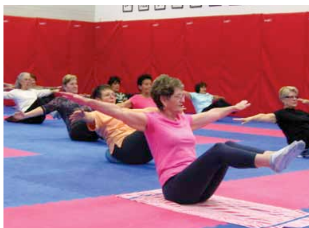
Séance de gym à la Maison des sports