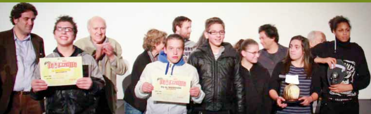
La classe relais le 30 novembre 2013 à Libourne