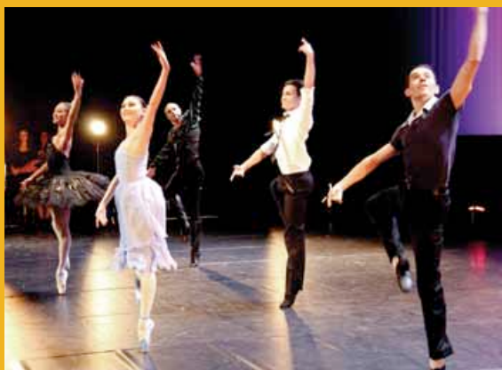
Clôture de la Conférence dansée 2013 avec les danseurs et danseuses de l'Opéra de Paris et de l'Opéra de Bordeaux