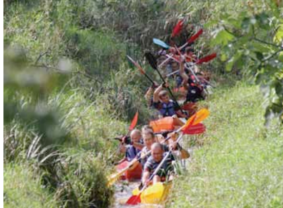
Raid des Gabelous en septembre 2013

Mais derrière ce défi sportif, se cache aussi le moyen de sensibiliser la population aux patrimoines. «Hommes, femmes, sportifs moyens ou confirmés, nous souhaitons nous adresser au plus grand nombre. Cette année, le raid a traversé le