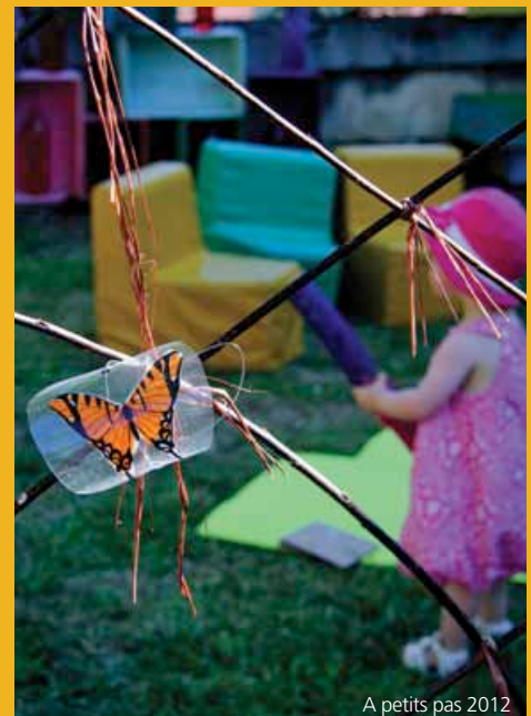
A petits pas 2012