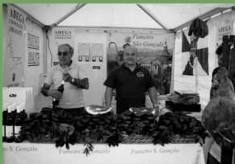
Marché portugais 2011