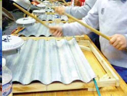
Ateliers Urban Ballets au Rocher de Palmer et Vélos Sound System au domaine du Loret