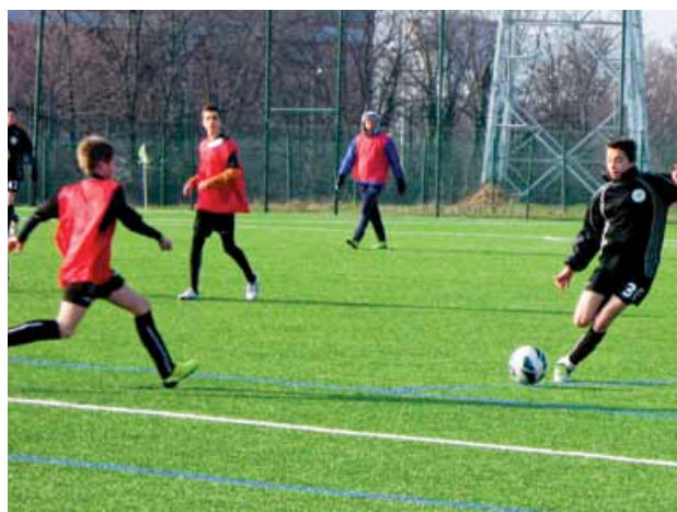
Entraînement sur le terrain de la Blancherie