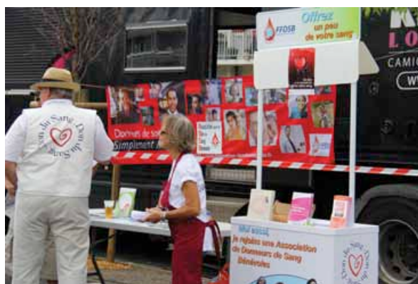
Informations sur le don du sang lors du championnat de voitures à pédales. L'ESF Aquitaine/Limousin organise directement les collectes avec la Mairie de Cenon (proposition de jours et de prêts de locaux). Notre rôle consiste à promouvoir cet acte de solidarité et à rechercher de nouveaux donateurs».