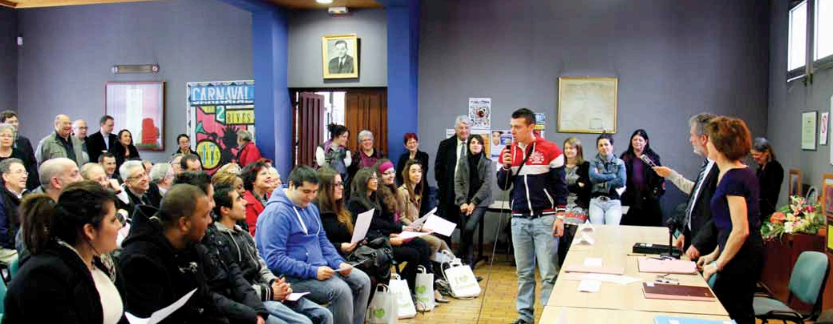
Signature des Contrats d'Avenir le 2 mars 2013, avec Alain David, Maire de Cenon et en présence de Michèle Delaunay, Ministre chargée des personnes âgées et de l'autonomie