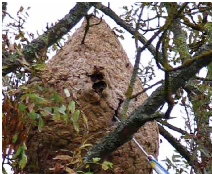
Nid de frelons asiatiques à Cenon

La présence d'un nid à hauteur d'homme ou d'habitation doit donc nécessiter des précautions de votre part. N'intervenez pas vous-mêmes et faites intervenir un spécialiste rapidement pour opérer sa destruction.