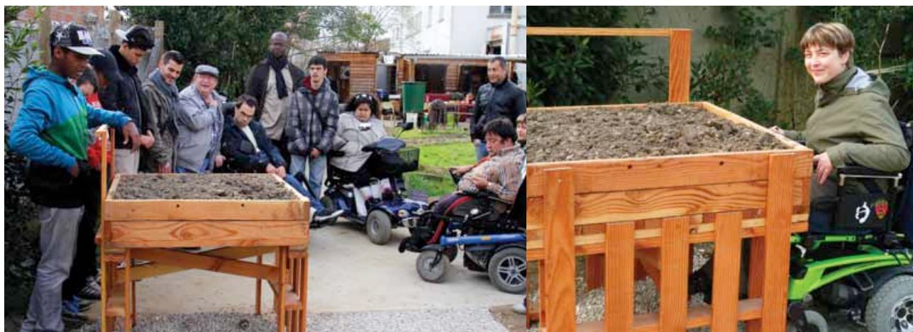
Bac surélevé et accessible au Jardin des 1001 feuilles

IMPLANTÉ DEPUIS 2010 AU BOUT DE LA COULÉE VERTE SECTEUR DU 8 MAI 1945, LE JARDIN PARTAGÉ «LES MILLE ET UNE FEUILLES» RÉUNIT HABITANTS NOVICES ET EXPÉRIMENTÉS DANS L'ART DU JARDINAGE. UN ESPACE DE CULTURES COLLECTIVES, DÉSORMAIS SOUS LA HOULETTE DE L'ASSOCIATION «PLACE AUX JARDINS» (JEUNE POUSSE DE L'ASSOCIATION «TERRE D'ADÈLES») ET QUI MONTE, EN PARTENARIAT AVEC L'AJHAG ET L'AGIMC (ASSOCIATION GIRONDINES DES INFIRMES MOTEURS CÉRÉBRAUX) DES CLUBS NATURE ADAPTÉS.