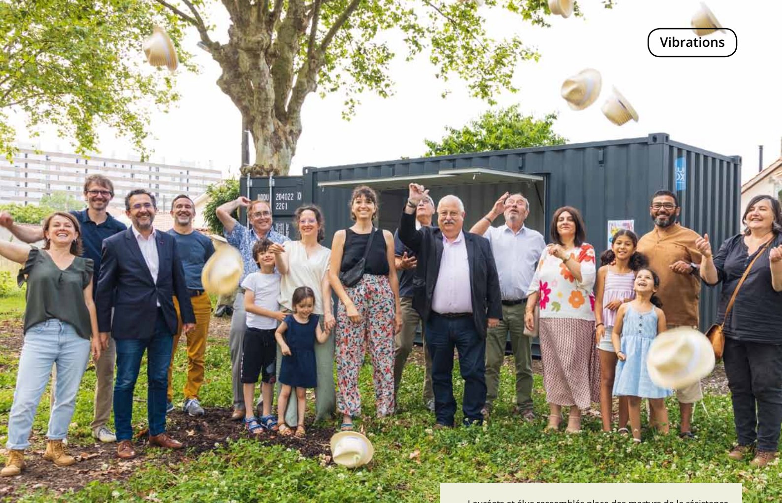
Lauréats et élus rassemblés place des martyrs de la résistance, lieu des Dimanches du Haut Cenon.