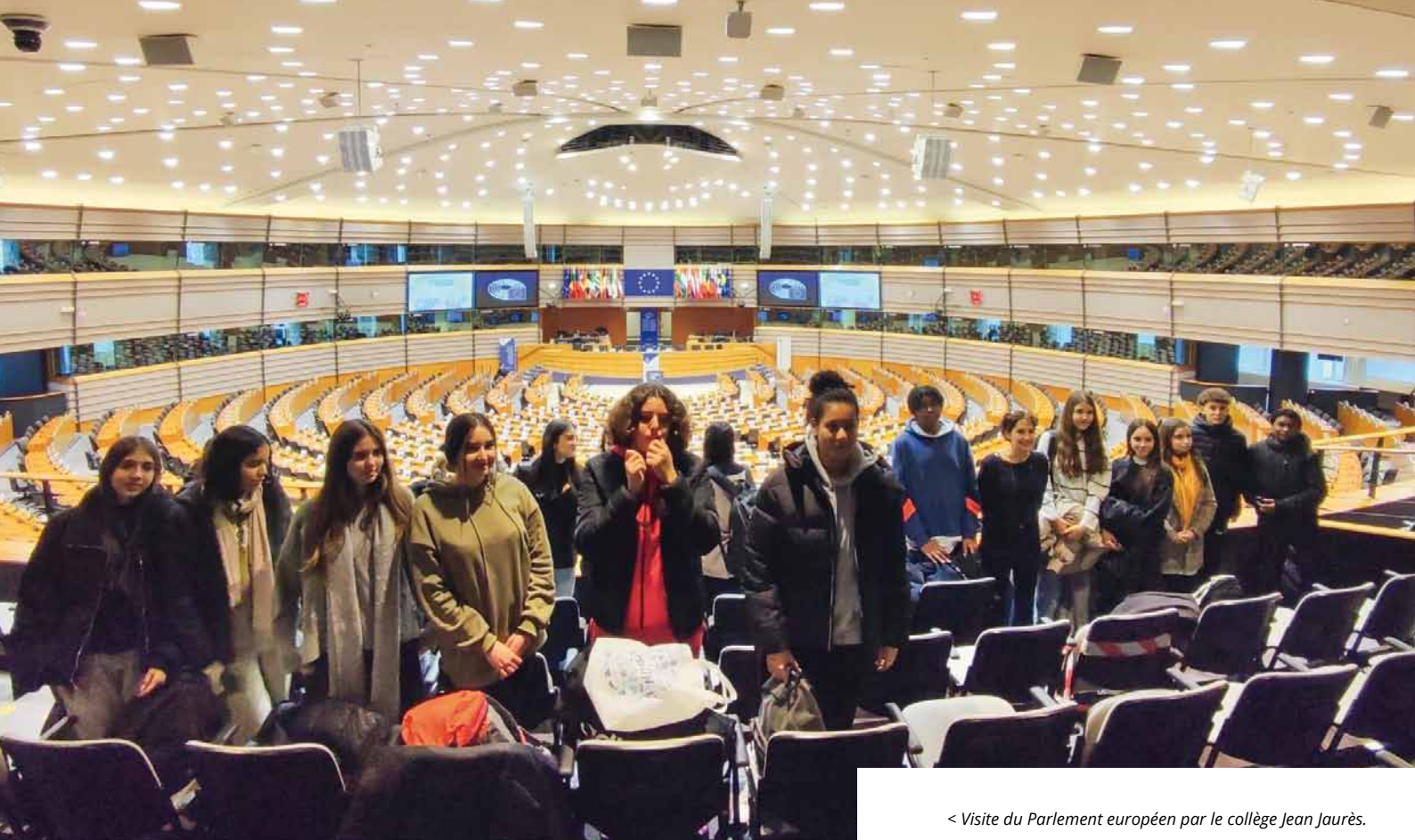
< Visite du Parlement européen par le collège Jean Jaurès.