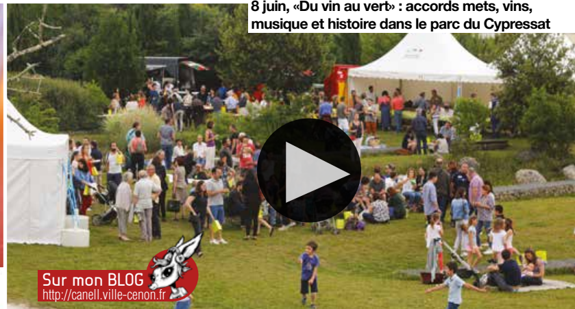
Sur mon BLOG http://canell.ville-cenon.fr