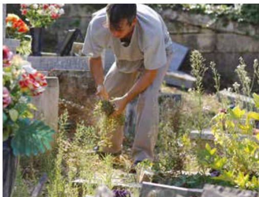
Entretien des cimetières : un travail au quotidien