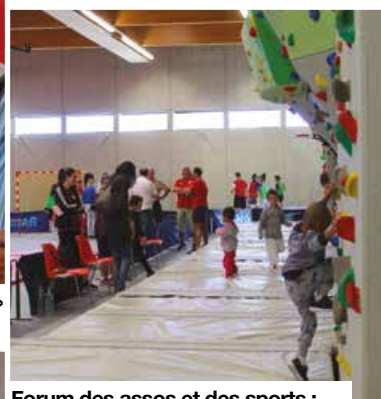
Forum des assos et des sports : choisir une activité pour soi, pour ses enfants...