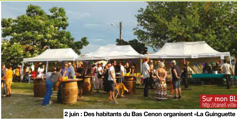
2 juin : Des habitants du Bas Cenon organisent «La Guinguette des Voisins de Testaud»

Dans les quartiers, en mode quinguette ou block party, dans les parcs, en mode grand écran ou bons sons, les fêtes de l'été cenonnais ont rassemblé toutes les générations. Des fêtes et des événements réussis grâce à ce cocktail de vitamines C ( C comme Cenonnais.e.s et Citoyen.ne.s) qui mélange l'enthousiasme d'habitant.e.s motivé.e.s et les compétences d'associations engagées, oeuvrant ensemble à l'organisation. Avec en final, le Forum des asso et des sports.