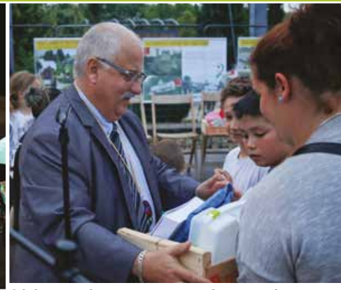
8 juin, «Du vin au vert» : accords mets, vins, musique et histoire dans le parc du Cypressat