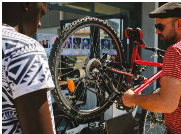
Atelier réparation de vélos par la Maison itinérante du vélo - Espace S. Signoret

Depuis quelques mois, «La Maison itinérante du vélo propose des ateliers de réparation participatifs sur la Rive droite*. Le Vélo-école est intervenu à Camille Maumey. C'est bien d'éduquer les enfants dans ce sens, car un vélo en plus, c'est une voiture en moins ! C'est un enjeu de santé publique, de lutte contre la pollution».