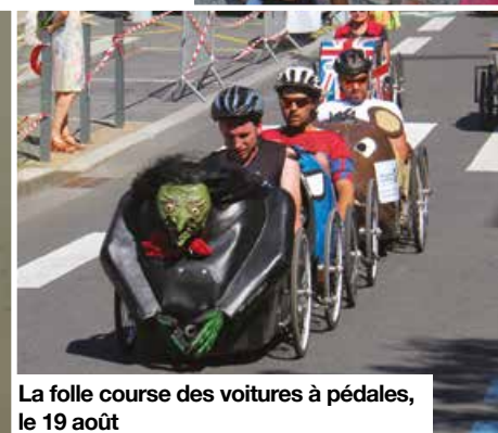
La folle course des voitures à pédales, le 19 août