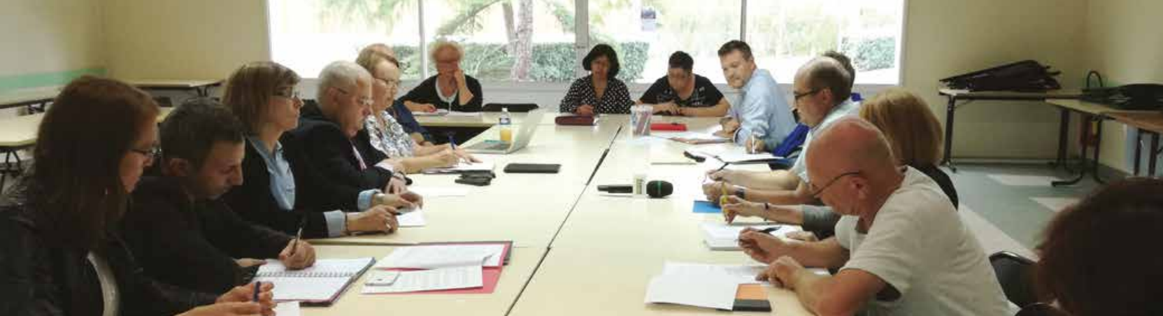
Le Conseil Citoyen du Bas Cenon en réflexion avec les élu.e.s et expert.e.s techniques du renouvellement urbain