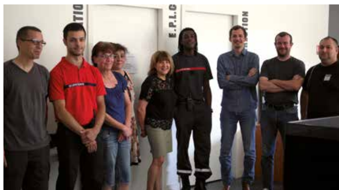
Une partie de l'équipe de l'EPLC le Rocher de Palmer

Originaire de Reims, 36 ans, le nouveau directeur de l'EPLC est ingénieur des Travaux publics de l'État. «J'ai travaillé à Paris, puis à Rennes tout en m'investissant comme bénévole dans des théâtres et des festivals. J'y ai rencontré des artistes et des professionnels du spectacle qui m'ont donné envie de me reconverter. Après