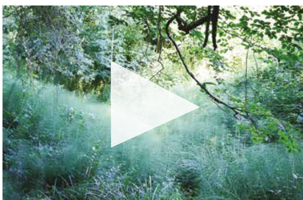
Les sous bois du parc Palmer, classés ENS

Les ENS locaux sont validés par le conseil départemental de Gironde. Ils consacrent des espaces remarquables pour leur patrimoine environnemental, ouverts au public et «qui ne sont pas entretenus de façon horticole», précise Julien Briton, responsable du service environnement à Cenon. L'idée est de respecter, comme son nom l'indique, l'aspect naturel de ces lieux. En s'engageant à préserver ces espaces, Bassens, Cenon, Floirac et Lormont, bénéficient en contrepartie d'une subvention de près de 80% du budget dédié à la gestion du parc des coteaux*.