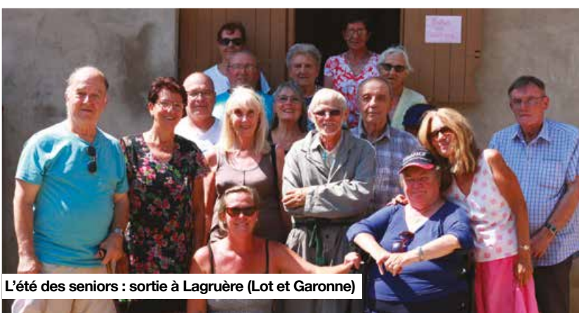
L'été des seniors : sortie à Lagrùère (Lot et Garonne)