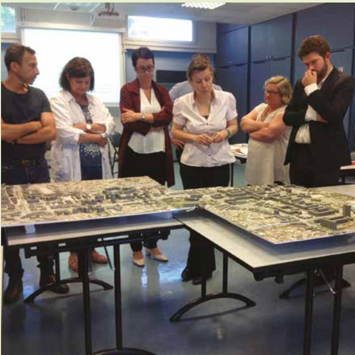
Façonner un projet urbain avec tous les partenaires

RENCONTRES AVEC QUATRE INDISPENSABLES ACTRICES ET ACTEURS DE LA PRÉPARATION DES PROJETS DE RENOUVELLEMENT URBAIN (PRU) : DEUX PROFESSIONNEL.L.E.S DE L'INGIÉNERIE DE PROJETS (EXPERTISE TECHNIQUE) ET DEUX MEMBRES DES CONSEILS CITOYENS (EXPERTISE D'USAGE DE LA VILLE).