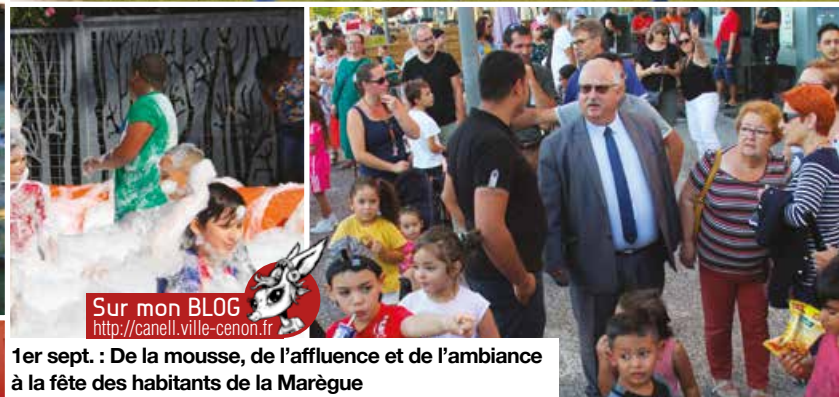
1er sept. : De la mousse, de l'affluence et de l'ambiance à la fête des habitants de la Marègue