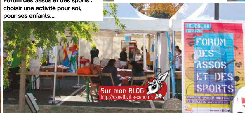
Sur mon BLOG http://canell.ville-cenon.fr