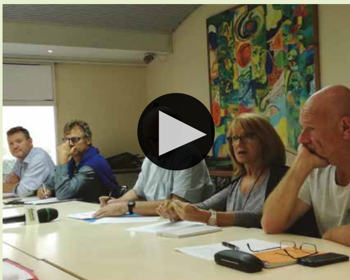
Conseil citoyen : faire entendre sa voix

l'accompagnement dans leur relogements sont cruciaux. Le relogement transformant complètement la vie des habitants, il doit se faire à partir de leur mobilisation, avec leur adhésion dans une dynamique positive pour eux. Cette démarche fédère les bailleurs, les travailleurs sociaux, le CCAS... La concertation est un outil essentiel de réussite pour ces opérations.