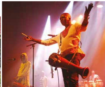
21 juin : Touré Kunda pour la fête de la musique au Rocher de Palmer