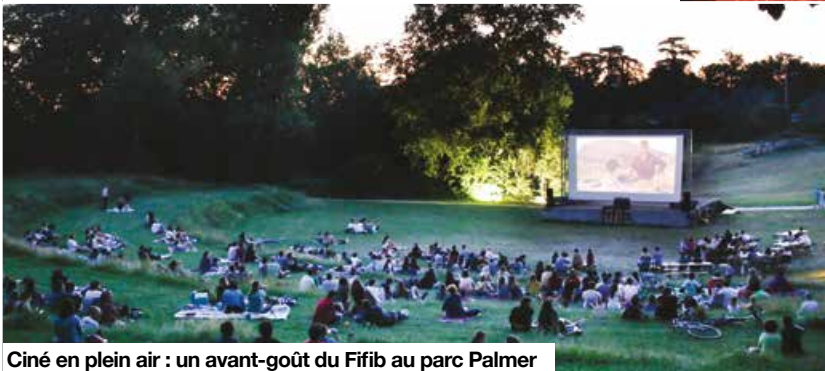
Ciné en plein air : un avant-goût du Fifib au parc Palmer