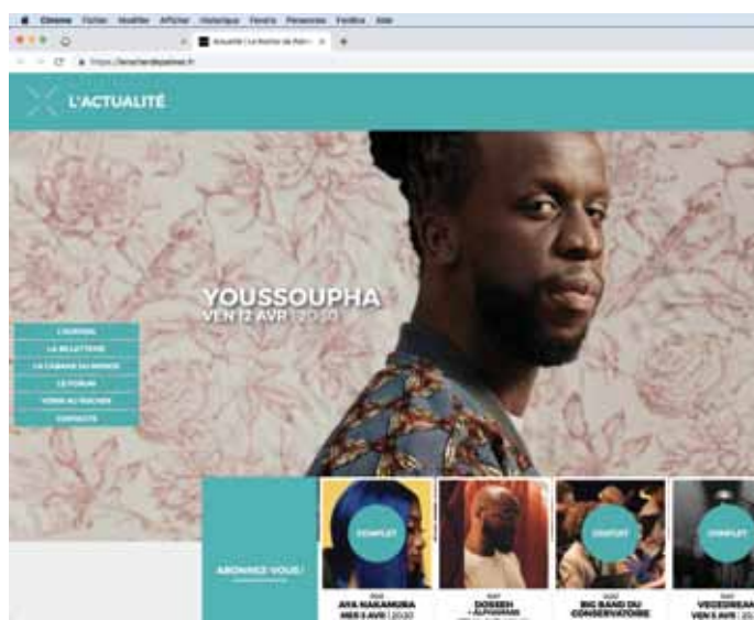
Web design par Alain Sautreau

Et Alain Sautreau, de préciser : « le graphisme n'est qu'une des briques parmi d'autres pour atteindre ces objectifs. »