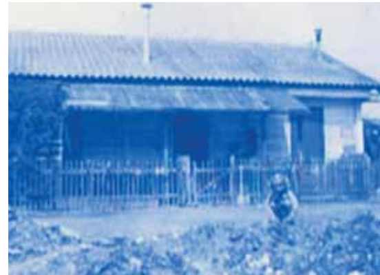
Une maison en bois dans le quartier Testaud dans les années 30