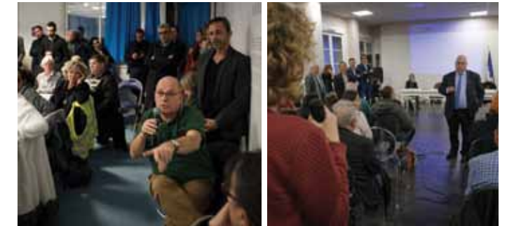
7 et 8 mars : réunions publiques de présentation des 2 PRU