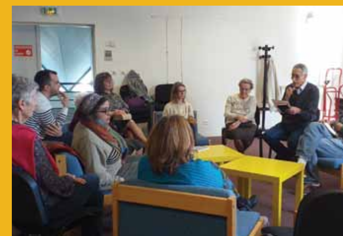
Le plaisir partagé de la lecture dans le cadre du 6ème prix littéraire « Saveurs d'ailleurs »

1 Littéralement « Petit poussin » - 2 Littéralement « Je te vois » Portrait de Cenonnais-e par Isabelle Agi