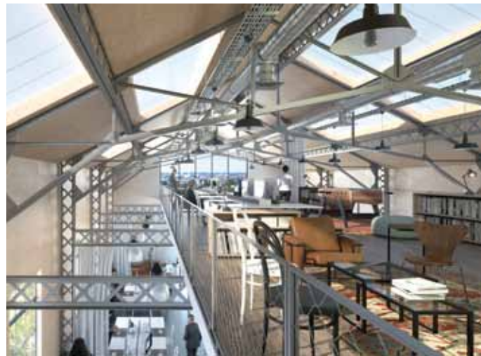
Le Futur « Open Space » de la Food factory.