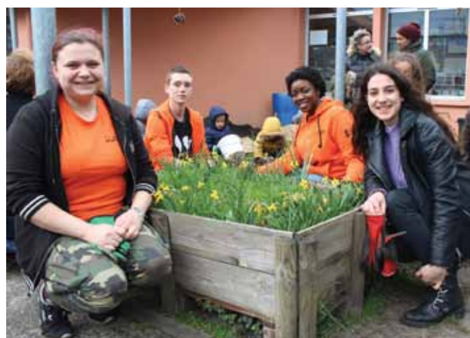
Les mains (vertes) dans la terre avec les élèves de la maternelle Jules Guesde

Le jeudi, nous animons un Temps d'Activités Périscolaires (TAP) à l'école des Cavailles. Et vu son emplacement, - au croisement de plusieurs rues, dont l'une est empruntée à double sens par les vélos - il est opportun d'y faire de la prévention. Ceux qui ne savent pas faire de vélo, apprennent avec nous. Nous proposons de la sensibilisation au code de la route, des ateliers de réparation et de customisation. Et avec l'association Vélo-cité, nous intervenons à l'échelle de la Rive Droite. En clôture de cette action, nous organisons une sortie vélo à travers la ville et ses environs. »