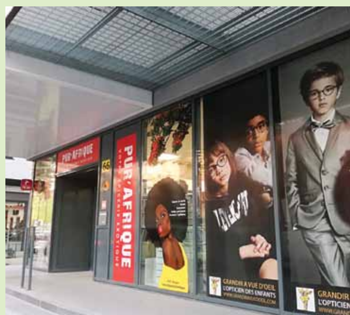
Côté pair de l'avenue Jean Jaurès : une offre commerciale diversifiée